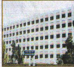
ತಾಂತ್ರಿಕ ಶಿಕ್ಷಣ ಇಲಾಖೆ

ಉಳಿದ ಬಾಕಿ: ಸರ್ಕಾರಿ ನೌಕರರಿಗೆ ತುಟ್ಟಭತ್ಯೆ ಘೋಷಣೆಯಾದಾಗ ಮೂರ್ನಾಲ್ಕು ತಿಂಗಳ ಬಾಕಿಯನ್ನು ಕಾಲೇಜುಗಳು ನೌಕರರಿಗೆ ಪಾವತಿಸಿವೆ. ಇದಲ್ಲದೆ, ಸರ್ಕಾರದಿಂದ ಅನುದಾನ ಬಿಡುಗಡೆಯಾಗುವ ಮುನ್ನವೇ ಗಳಿಕೆ ರಚಿಯನ್ನೂ ಸಹ ನೌಕರರಿಗೆ ಪಾವತಿ ಮಾಡಲಾಗುತ್ತದೆ. ಕಾಲೇಜಿನ ವ್ಯವಹಾರಗಳನ್ನು ಪ್ರತಿ ವರ್ಷ ಆಡಿಟ್ ನಡೆಸಿ ವರದಿ ನೀಡಿದ ಬಳಿಕವಷ್ಟೇ ಈ ಹಣ